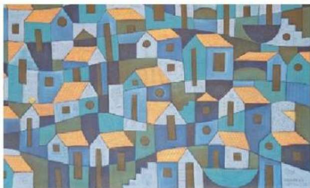
Le peintre Sérgio Ramos. Sous son pinceau, les maisons de Tiradentes ondulent comme des vagues.